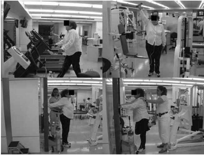
Figura 4. Sequência de exercícios para uma paciente no Centro de Reabilitação do Hospital Israelita Albert Einstein (HIAE)