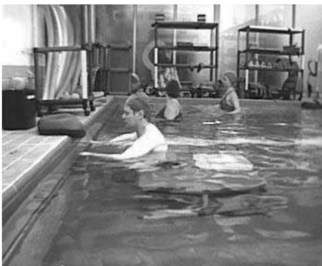
Figura 2. Paciente em sessão de Hidroterapia no Centro de Reabilitação do Hospital Israelita Albert Einstein (HIAE)