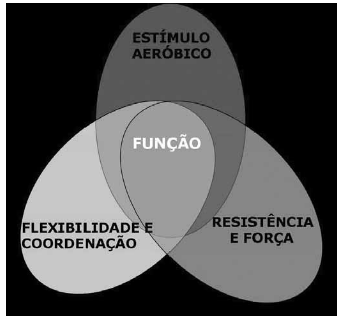
Figura 3. Componentes musculoesqueléticos da função motora

A integridade dos diversos componentes musculoesqueléticos promove uma funcionalidade adequada (Figura 3). Os exercícios que contribuem para restaurar esta integridade podem ser classificados como (13) :